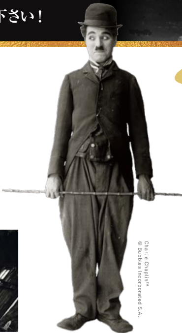
Charlie Chaplin