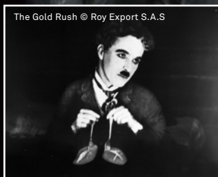
The Gold Rush