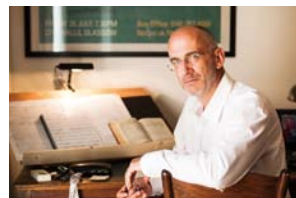
ティモシー・ブロック

今回の生オケ・シネマを指揮するのは、多数のサイレント映画コンサートの指揮をつとめ、チャップリン映画の音楽を譜面に復元し自ら指揮するスペシャリスト、ティモシー・ブロックが前回に続き登場！今回使用されるスコアはブロックが復元したもの。チャップリンの音楽がこの生オケ・シネマでドラマティックに蘇り、生演奏ならではの臨場感をお楽しみいただけます！