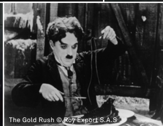
The Gold Rush