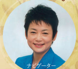
ナビゲーター 好本 恵 (元NHKアナウンサー)