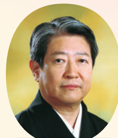
富山清琴(人間国宝) [歌・三絃]