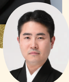
富山清仁 [歌・三絃・箏]

お話では、立女形の神髄や歌舞伎の魅力と裏話、プライベートを語り、 素踊りでは、衣装や化粧をつけず、身体一つで美を表現する。 磨き上げられた芸、鍛え抜かれた身体に両面から迫る90分。