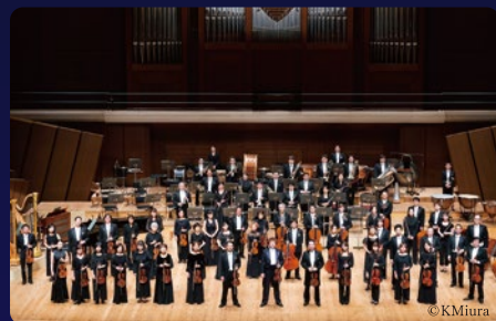
新日本フィルハーモニー交響楽団