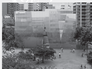
すみだ北斎美術館外観イメージ

1956年生まれ。慶應義塾大学卒。演劇評論家。東京藝術大学美術学部先端芸術表現科教授。紀伊国屋演劇賞審査委員。著書に『天才と名人 中村勘九郎と坂東三津五郎』『菊五郎の色気』(文春新書)、『菊之助の礼儀』(新潮社)など。蜷川幸雄との共著に『演出術』(ちくま文庫)。また、編著に『坂東三津五郎 歌舞伎の愉しみ』『坂東三津五郎 踊りの愉しみ』(岩波現代文庫)などがある。