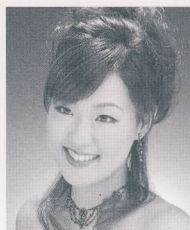
三宅理恵 [ソプラノ]