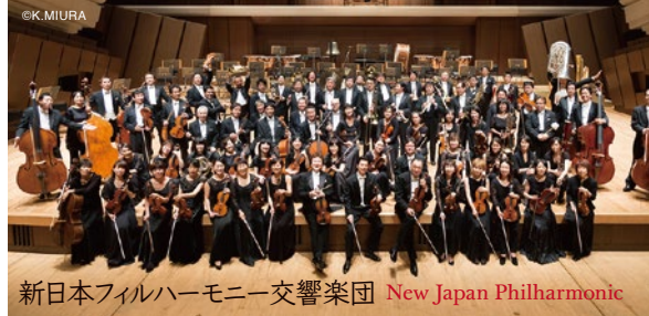
新日本フィルハーモニー交響楽団 New Japan Philharmonic